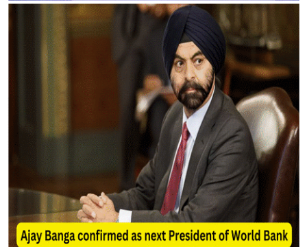
Ajay Banga confirmed as next President of World Bank

(C) भारतीय मूल के अजय बंगा को आधिकारिक तौर पर विश्व बैंक के नए अध्यक्ष के रूप में चुना गया है। विश्व बैंक के 25 सदस्यीय कार्यकारी बोर्ड ने अजय बंगा को पांच साल की अवधि के लिए चुना, जो पहले मास्टरकार्ड के सीईओ के रूप में कार्य कर चुके हैं। विश्व बैंक के बोर्ड ने संगठन की विकास प्रक्रिया पर श्री अजय बंगा के साथ काम करने की उत्सुकता व्यक्त की।